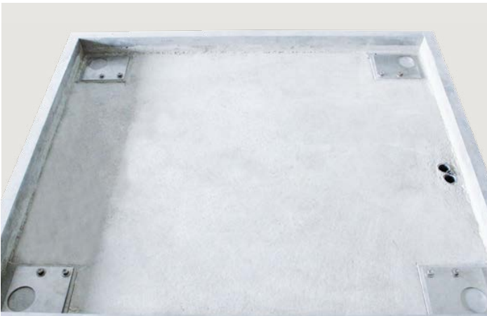
Montageeinbaurahmen, komplett mit Fußplatten, Schrauben, Dübel und Scheiben