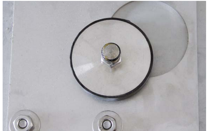
Montagesatz zur Fixierung bei aufgestellter Waage